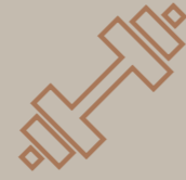
نادي رياضي GYM