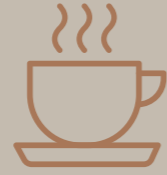
مقهى Café Shop